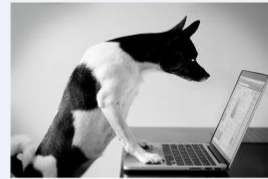
7 Clickbait Advertisements You Won't Believe! And we won't tell you more unless you click here right now. 2.7k Comments 11k Shares